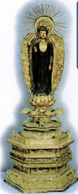
<光教寺ご本尊> 阿弥陀如来立像 “南無阿弥陀仏” 阿弥陀様のお計らいにお任せします、 帰依しますの意味

欧米の識者や哲学者は、数ある宗教の中で現代科学ともあまり矛盾しない宗教は仏教と言います。数回にわたってその例を紹介していきます。まず第1回は、 <運命は変えられますか？—因果応報とエピゲノム学> について概説します。吉崎御坊(第八世蓮如上人開山)に昔々、祖父母に連れられお参りしたことがありました。その門前で 「親の因果が子に報い」 という口上で芝居小屋の呼び込みがあったのを微かに覚えています。母と父の遺伝子を一個ずつ受け継いでこの世に生を受けた後で、遺伝子の総体=ゲノムの不可逆的变化によって運命は変えられません。しかし、遺伝子発現の可逆的变化であるエピゲノム変化によって、運命を変えることができます。親の生活習慣(喫煙、食事など)が子や孫にも伝わり、ゲノムが同一な一卵性双生児の個性の違いも、エピゲノムのなせる技です。